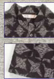
BL-184/ピンクタックをふんだんにのせたブラウス。前あきなので 羽織りものとしても重宝します。