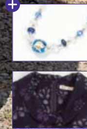
BS-66/ハル—シルエットのロングベスト。1枚だけで軽く仕上げました。