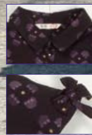
BL-173/肩先のリボンがポイント。重ね着でインナーも楽しめるブラウス。